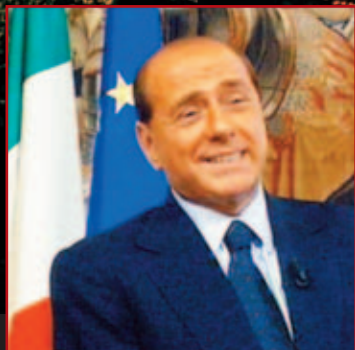
Viva Zapatero ! de Sabina Guzzanti