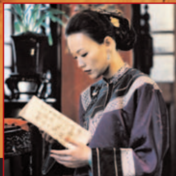
Three times de Hou Hsiao-Hsien