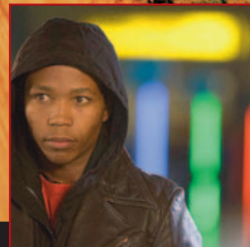
Tsotsi de Gavin Hood