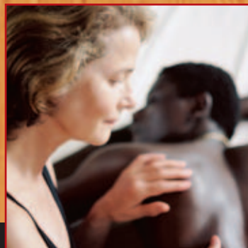
Vers le Sud de Laurent Cantet