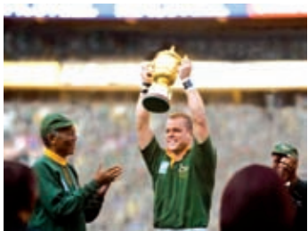
De Clint Eastwood Avec Morgan Freeman, Matt Damon, Scott Eastwood... USA, 2009, vo ss-tt, 2h12