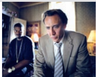
De Werner Herzog Avec Nicolas Cage, Eva Mendes, Val Kilmer... USA, 2009, vo ss-tt, 2h02

Pendant l'occupation américaine de Bagdad en 2003, un groupe de soldats pour mission de trouver des armes de destruction massive sensées être stockées dans le désert irakien. Ils vont découvrir rapidement une importante machination qui va modifier le but de leur mission et que la vérité est la plus insaisissable de toutes les armes. Avec « Green Zone », Paul Greengrass (« Bloody Sunday », « Vol 93 ») s'affirme une nouvelle fois comme un franc-tireur courageux au sein du cinéma américain, parvenant à marier avec maestria le thriller politique documenté avec le film d'action explosif et frénétique.