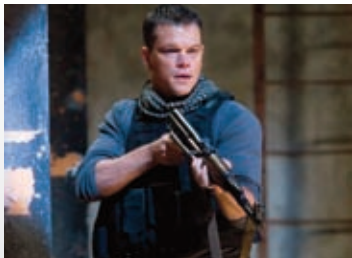
De Paul Greengrass Avec Matt Damon, Amy Ryan, Greg Kinnear... USA, 2009, vo ss-tt, 1h

En 1994, l'élection de Nelson Mandela consacre la fin de l'Apartheid en Afrique du Sud. Pour unifier un pays divisé sur le plan racial et donner à chaque citoyen un motif de fierté, le nouveau Président mise sur le sport et fait cause commune avec le capitaine de la modeste équipe de rugby sud-africaine dans le but de participer au Championnat du Monde. Dans un nouvel élan humaniste, Clint Eastwood s'attaque cette fois au sport, toujours avec conviction et émotion. Il offre à Morgan Freeman l'un de ses plus beaux rôles à l'écran dans cette aventure humaine placée sous le signe de la réconciliation des peuples.